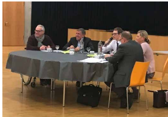
Table-ronde « Sécherheet am Stroosseverkéier » sur initiative des étudiants d'une classe de 2 e du Lycée Nic Bieber à Dudelange, en présence du ministre du MDDI, de la directrice de La Sécurité Routière, du directeur des Ponts et Chaussées et du président de l'AVR.