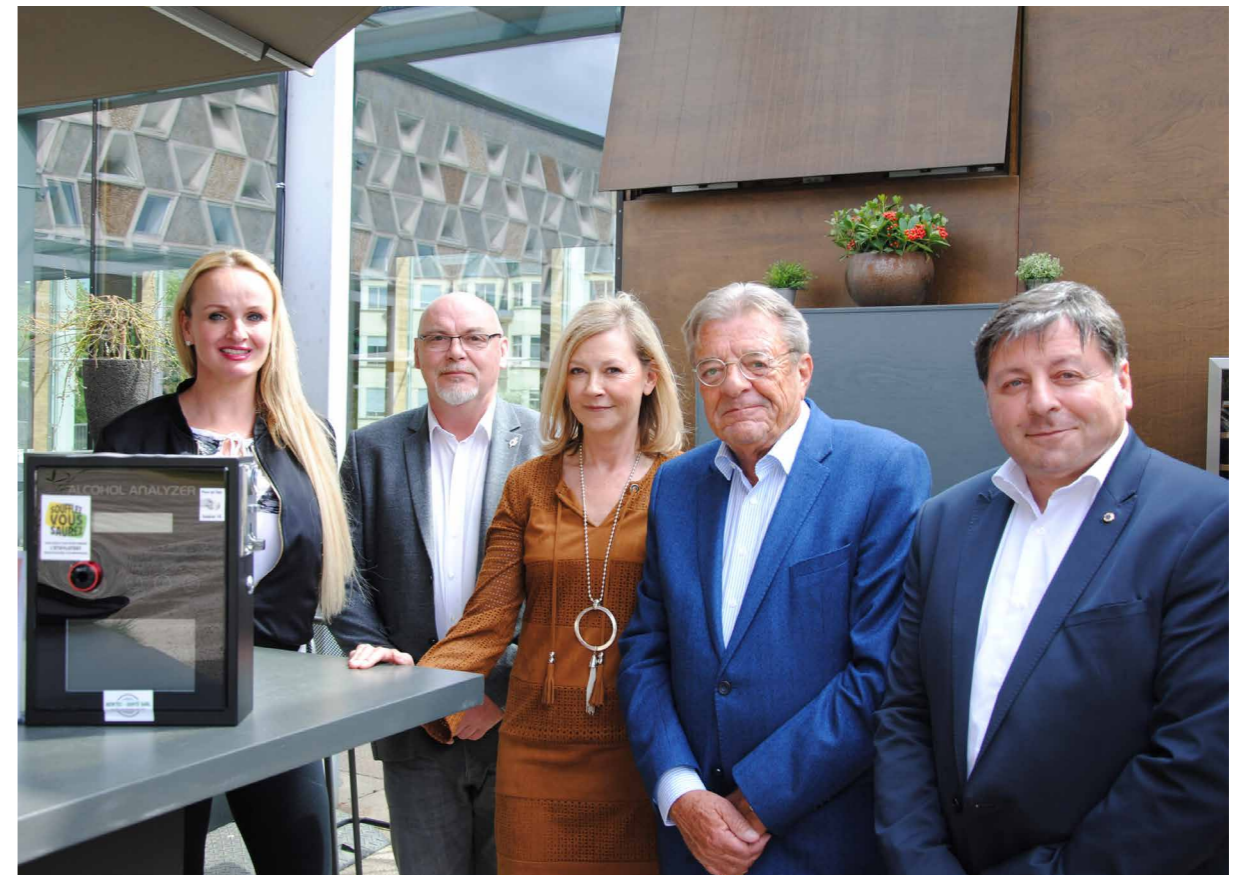
Les initiateurs de l'action « Etyhloborne » avec les responsables de La Sécurité Routière et la gérante de la Brasserie Schuman.

La Sécurité Routière en collaboration avec l'Horesca et Sources Rosport lancent deux nouvelles initiatives dans la lutte contre l'alcool au volant :