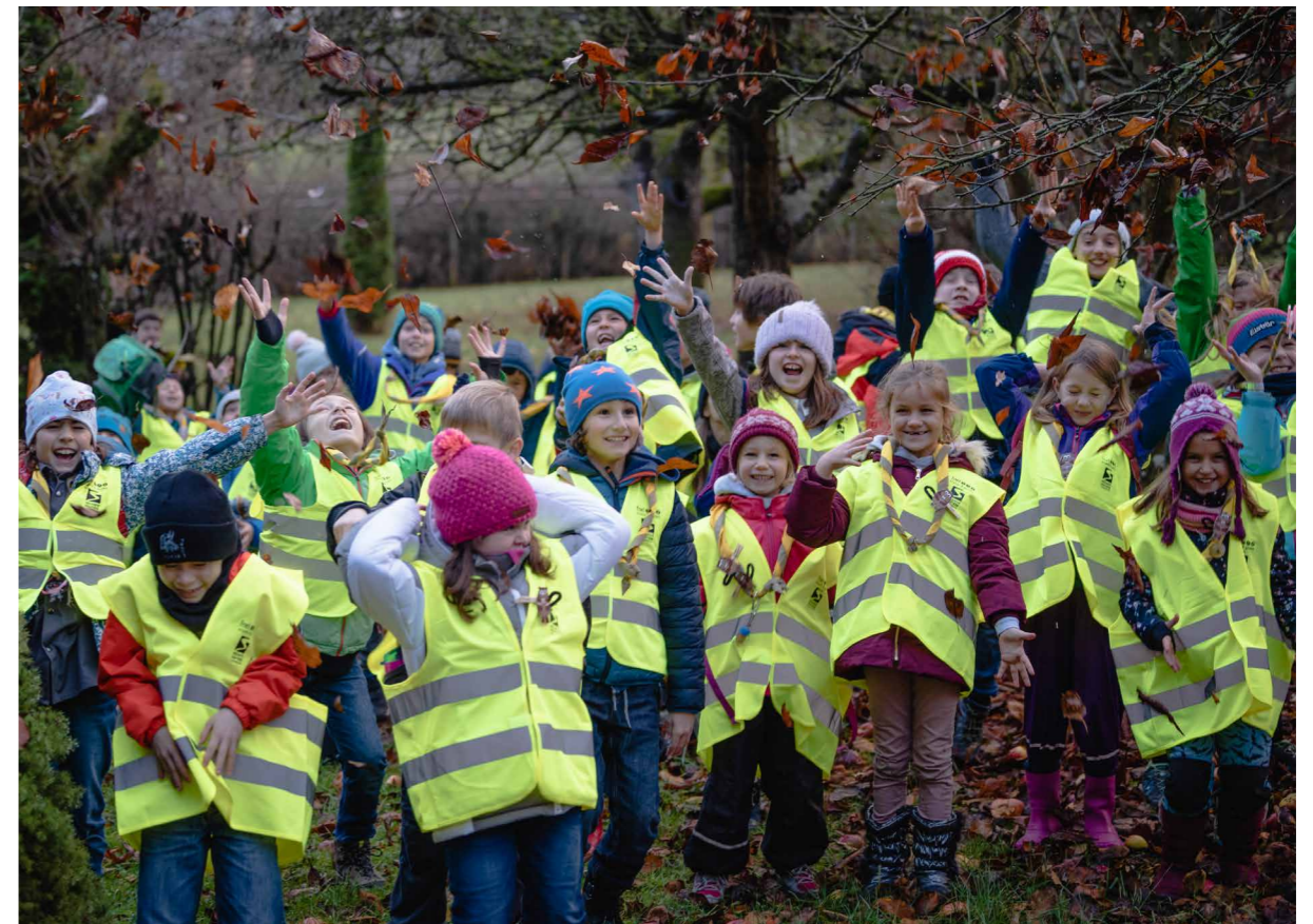
Des vestes réfléchissantes pour les scouts de la FNEL.

L'édition 2018 a été clôturée par la finale nationale le 8 juillet à Bertrange organisée en collaboration avec la commune, les enseignants, l'association des parents d'élèves et la Police.