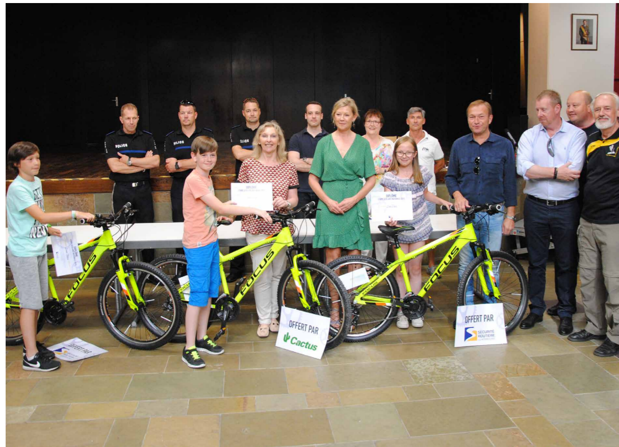
Finale de la coupe scolaire 2018 à Bertrange : remise des prix.